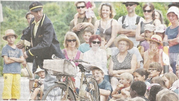
Il y a du Jacques Tati dans le facteur du collectif Gonzo qui fit fureur ce mardi.

Entre deux spectacles, ils scrutaient le ciel et croisaient les doigts, les organisateurs du Festival en bastides. Il faut dire que les annonces météo n'auguraient rien de bon pour les spectacles de rue. Et voir monter les nuages gras n'était pas pour les rassurer. La moindre goutte d'eau pouvant métamorphoser en Bérézina des instants de pur bon-