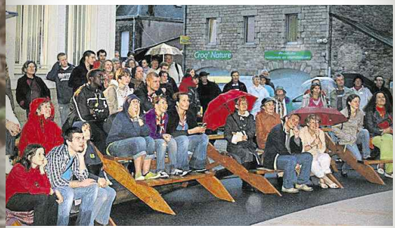
Malgré le temps incertain, quelque 200 personnes ont assisté au spectacle de rue des établissements « Morel et Morel », un spectacle dont on se souviendra.

Festival Fisel : 200 personnes au spectacle de rue