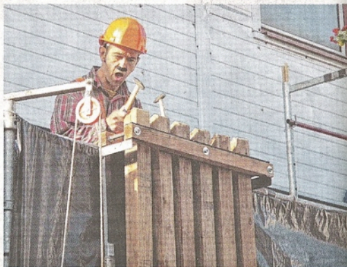
Les Ets Morel et Morel : entre théâtre de rue, spectacle musical et comédie burlesque.

Juste ce qu'il fallait pour que les fanfares reprennent le devant de la scène. Pour la sortie du CD Gonzo Live, elles vont marquer le coup. En musique évidemment.