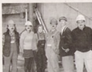
Les spectateurs ont apprécié le spectacle vivant et souvent surprenant.

Plusieurs milliers de Col... (text continues)