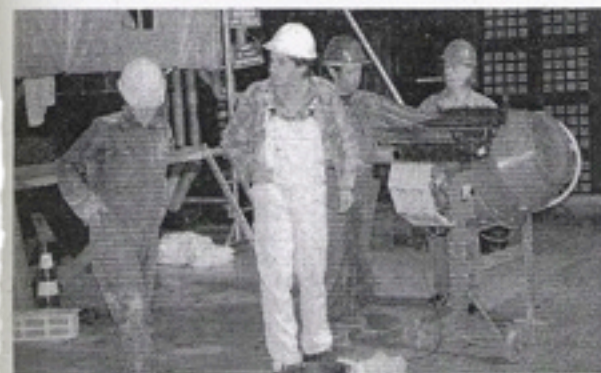
La création du collectif Gonzo, « Les Ets Morel et Morel » a fait un tabac, à la MCP, où l'on a dû refuser du monde... Mais le spectacle est promis à un bel avenir.

coup de rodé, ils sont prêts pour la saison l'Hexag Rencor entre p