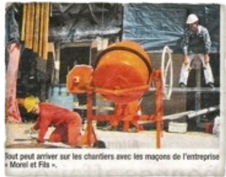
Tout peut arriver sur les chantiers avec les maçons de l'entreprise « Morel et Fils ».